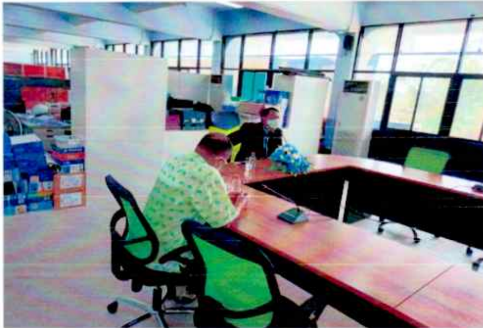
ท่านศึกษาธิการจังหวัดสุโขทัย กล่าวเปิดงานและ ดำเนินการพัฒนาบุคลากร ตามโครงการพัฒนาศักยภาพบุคลากรด้านการส่งเสริมวัฒนธรรมประเพณีไทย สำนักงานศึกษาธิการจังหวัดสุโขทัย