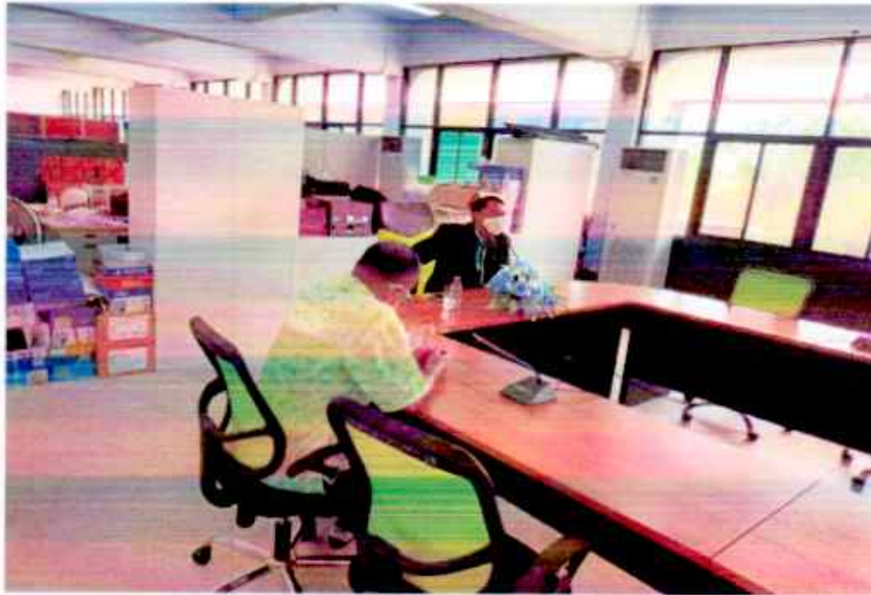
ท่านศึกษาธิการจังหวัดสุโขทัย กล่าวเปิดงานและ ดำเนินการพัฒนาศักยภาพบุคลากร ตามโครงการพัฒนาศักยภาพบุคลากรด้านการส่งเสริมวัฒนธรรมประเพณีไทย สำนักงานศึกษาธิการจังหวัดสุโขทัย